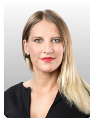
Sonja Rösch Kommunikation/Positionierung