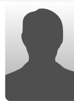
Uwe Diedrich Digitalisierung/Tourismus