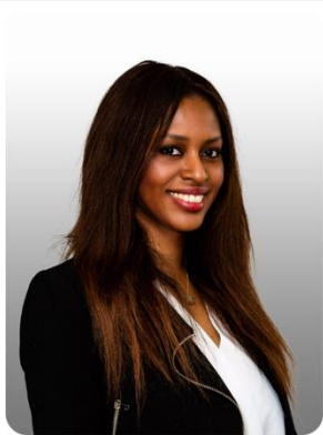
Bienvenue Angui Afrika/Frankophonie